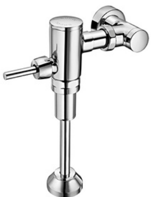
D-00407906 Fluxómetro mecánico para urinario