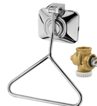
DA-00184906 Tapa para válvula de descarga para discapacitados, modelo BENEFIT