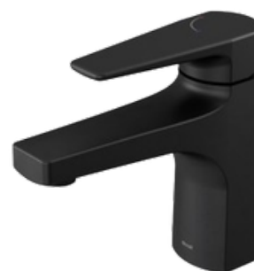
D-007959CE Grifería monomando para lavamanos modelo LIFT ONIX