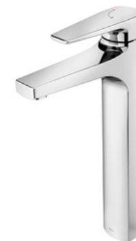
D-00796106 Grifería monomando pico alto, modelo LIFT