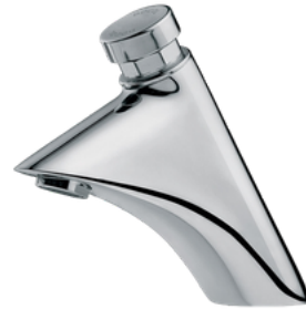
D-17161006 Grifería push button, modelo Noblesse