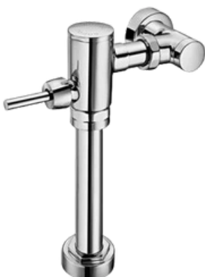
D-00257006 Fluxómetro mecánico para W.C.