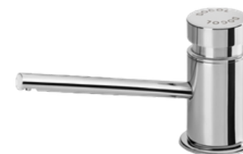
D-17200006 Dispensador de jabón líquido push button para tope de lavamanos