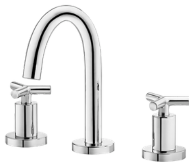
D-00364806 Grifería para lavamanos doblemando (línea residencial)