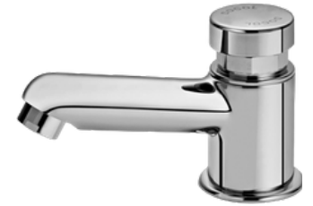
D-17160606 Grifería push button, modelo COMPACT