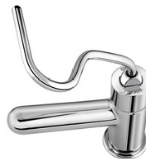
D-00045706 Grifería para discapacitados, modelo BENEFIT