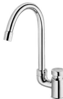
D-00444506 Grifería cuello de cisne push button