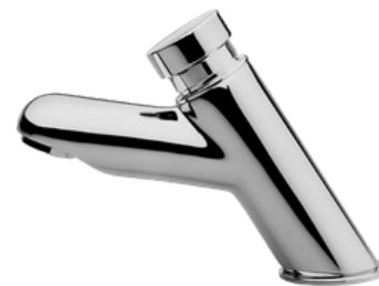
D-17160806 Grifería push button, modelo 110