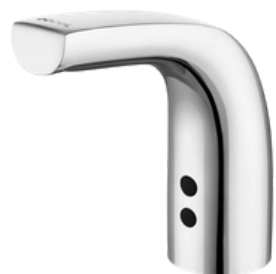
D-00045706 Grifería electrónica modelo ZENIT