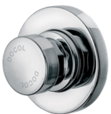
D-17120206 Push Button para ducha