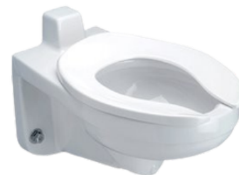
Z-5617-BWL W.C. back spud suspendido a la pared