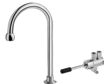
D-98719306 Grifería clínica cuello de cisne para válvula de pedal D-00490906 (por separado)