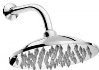
D-00185206 Ducha de pared, modelo BILBAO