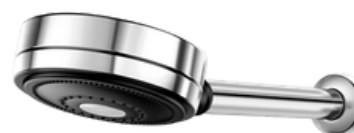
D-01204806 Ducha de pared, modelo TECHNOSHOWER