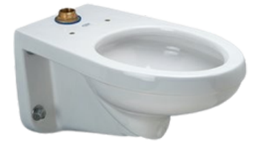
Z-5615-BWL W.C. top spud suspendido a la pared