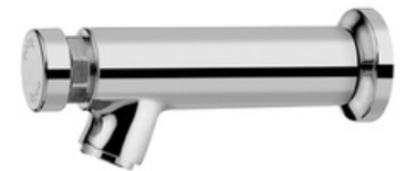
D-17160706 Grifería push button de pared, modelo 120