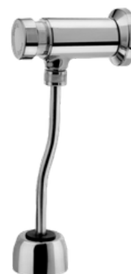
D-17010306 Fluxómetro push button para urinario, modelo COMPACT