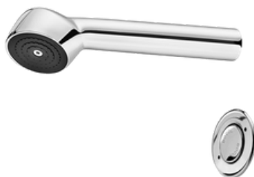
D-17125006 Ducha antivandálica con push button para embutir