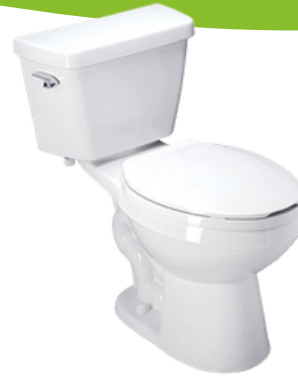
Z-5551-K W.C. con tanque de alto rendimiento