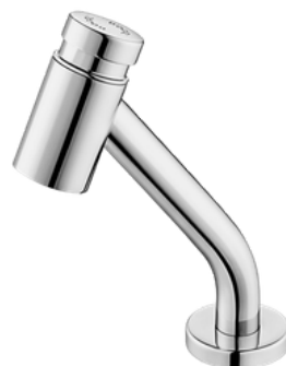
D-00652806 Grifería push button para lavamanos, modelo LOGGICA