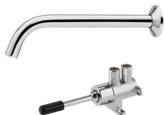
D-98719106 Grifería clínica cuello de cisne para válvula de pedal D-00490906 (por separado)