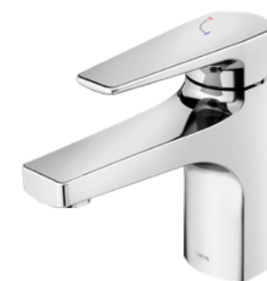
D-00795906 Grifería monomando para lavamanos, modelo LIFT