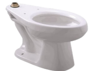
Z-5655-BWL1 W.C. top spud al piso