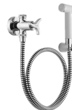
D-00502506 Ducha higiénica, teléfono con llave y derivador